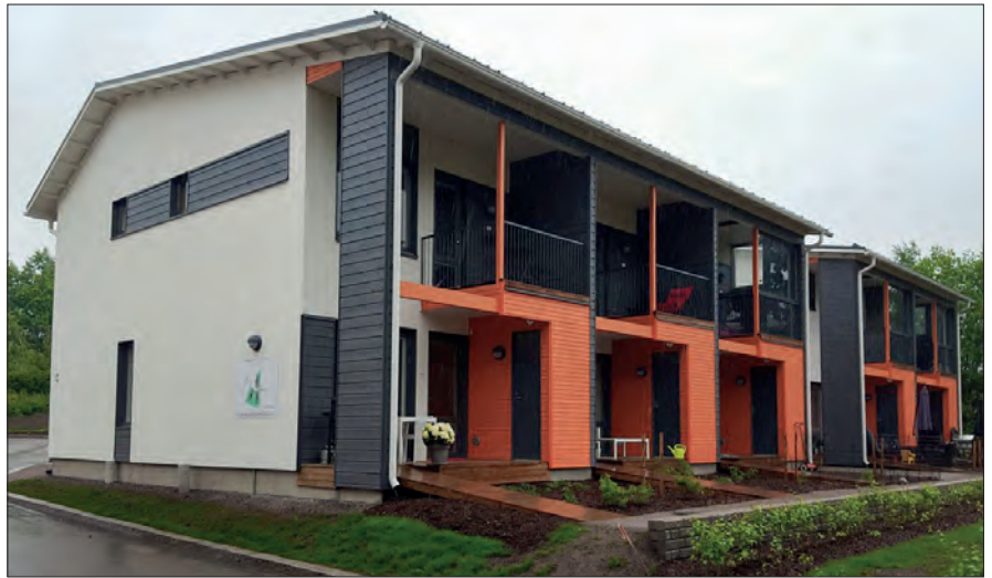
As Oy Helsingin Kapteenska, 23x145 UYV välimaalattu.

Puu-ulkoverhouksen maalausyhdistelmällä saavutetaan palosuojaus, hyvä säänkestävyys ja pitkäaikaiskestävyys valmiille pintamaalatuille ulkoverhouslaudalle.