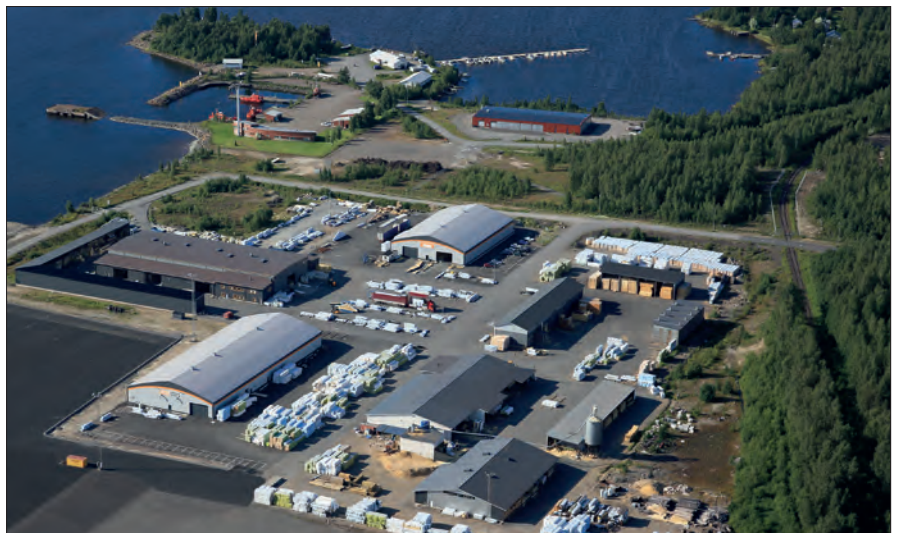
Woodcomp Oy, Raahen, Lapaluo