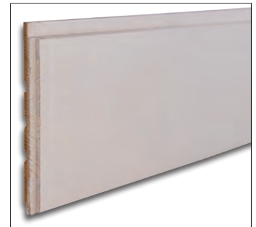
Liimattu 23 x 220 UYM, välimaalattu.