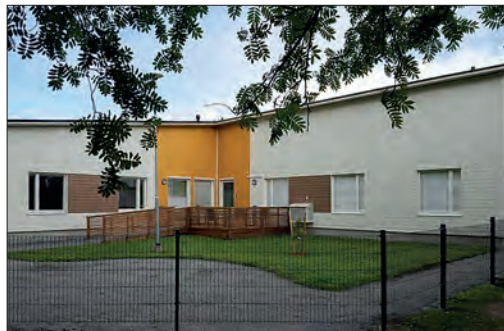
Mikeva hoivakoti Iisalmi. Palosuojattu ulkoverhous.